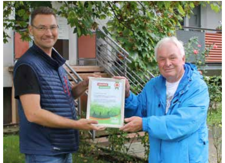
Übergabe der Urkunde am 28. September 2021

Auch Sie können den Bäumen und Sträuchern mit dem ein oder anderen Eimer Wasser etwas Gutes tun. Melden Sie sich noch heute bei uns als Baumpate an.